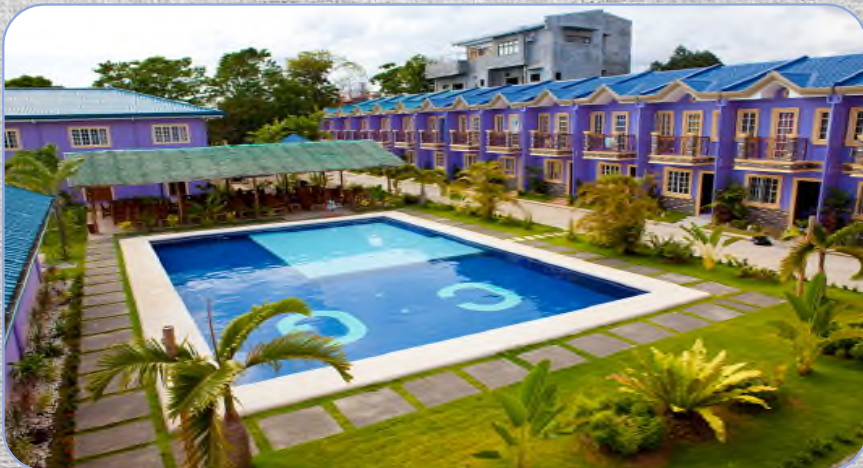
# CG ESL Center