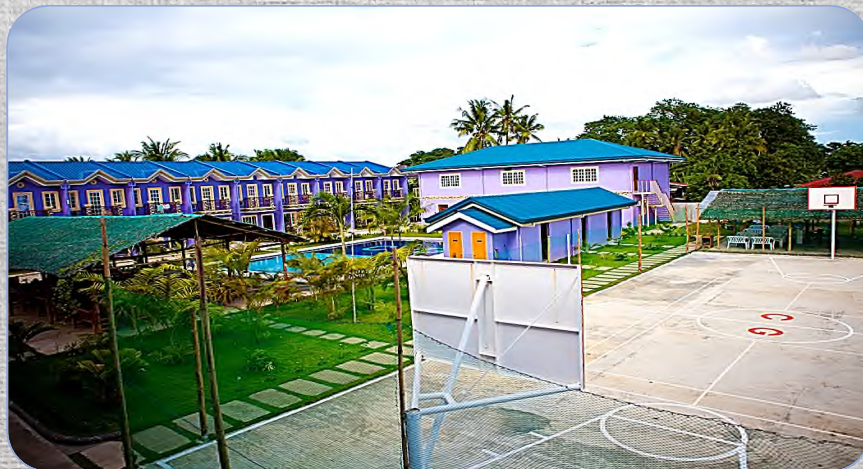
# Multipurpose Court