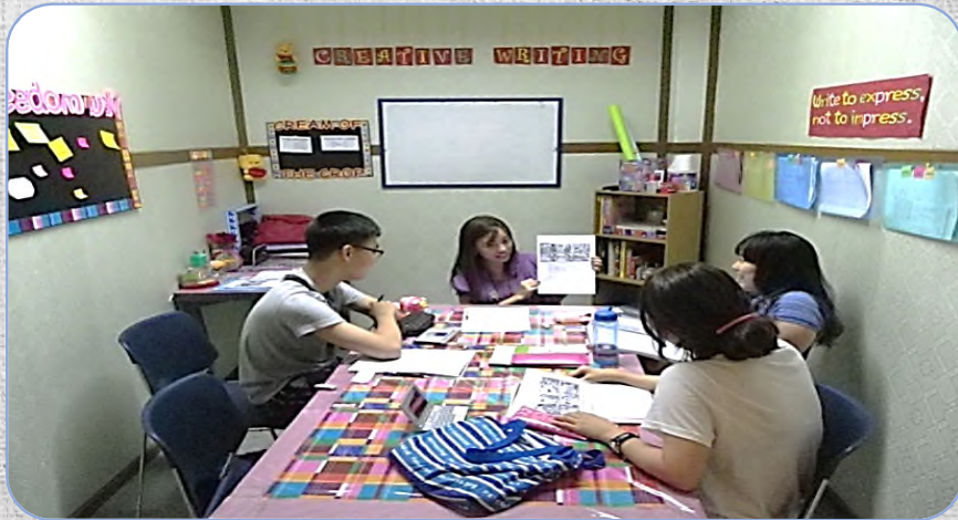
# Creative Writing