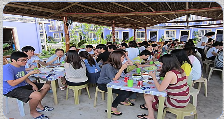
# Student Lounge