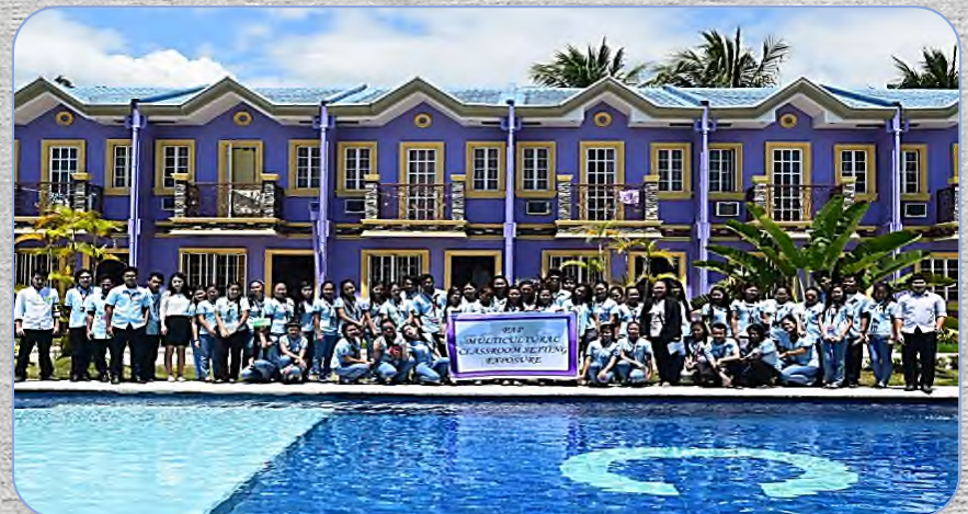
# Activity in CG