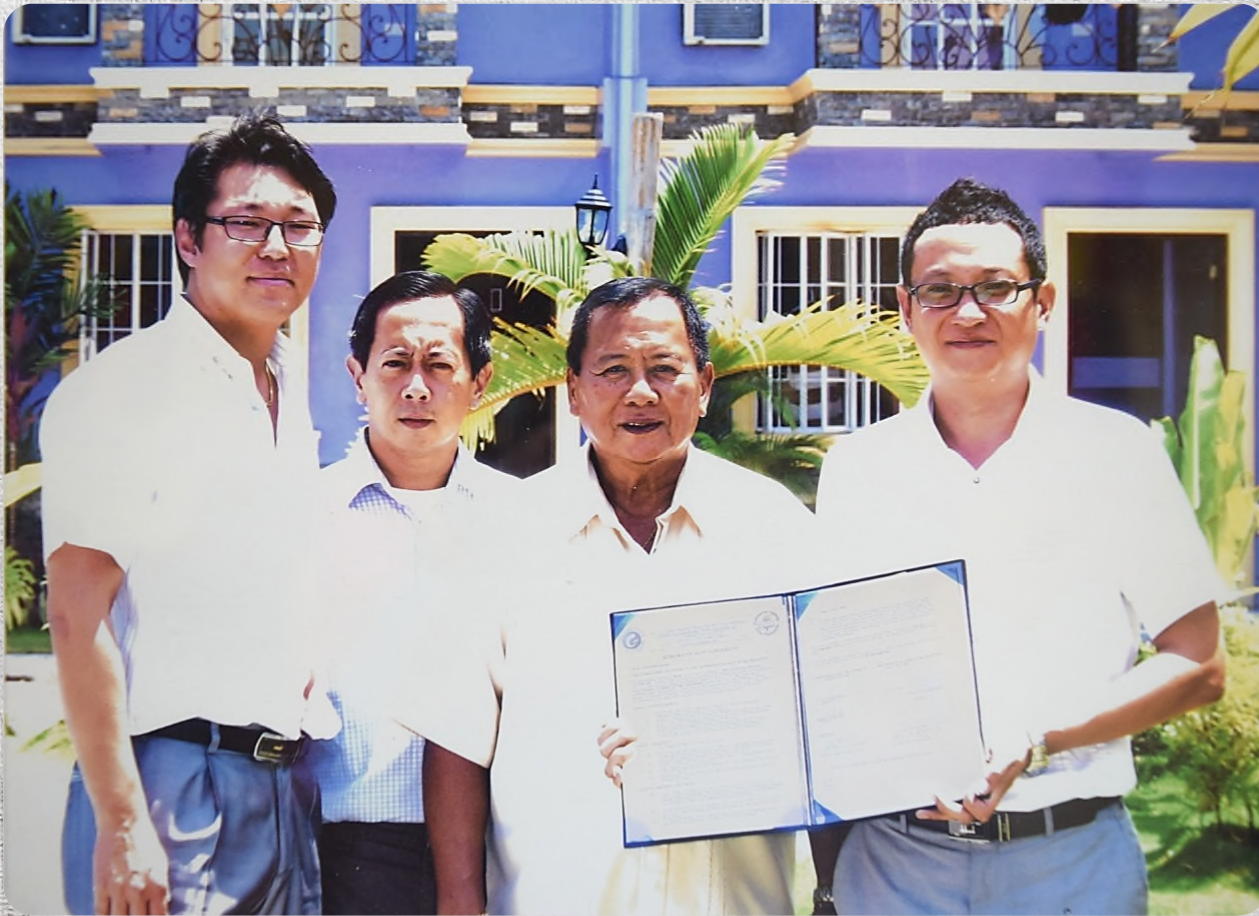
CG DIRECTORS AND PAP PRESIDENT