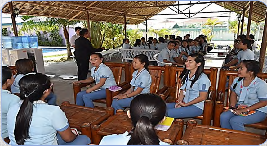
# Activity in CG