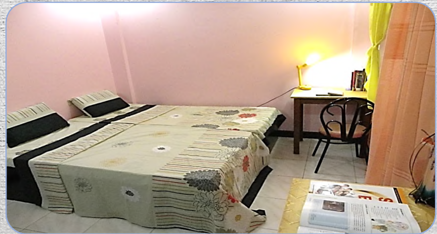
# Double Room