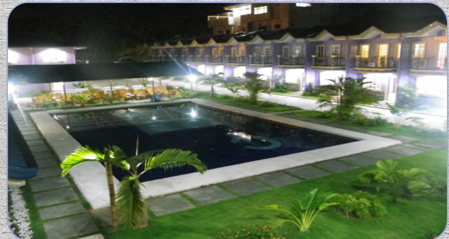
# CG ESL Center(Night View)