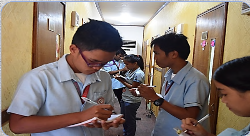
# Activity in CG