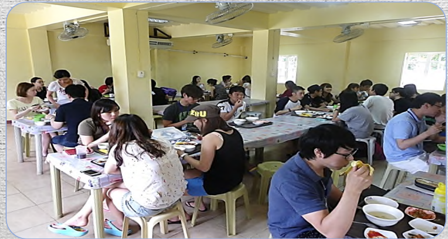
# Dining Room