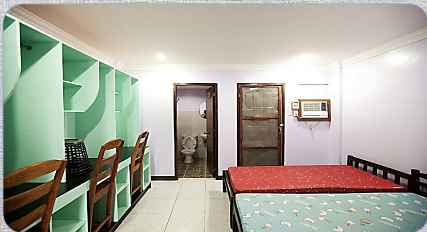
# Triple Room