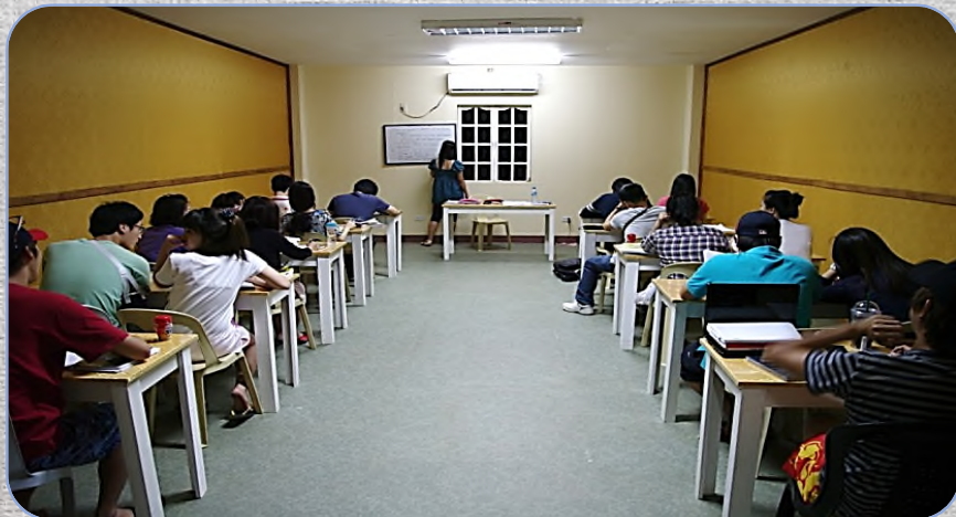
# Evening Class