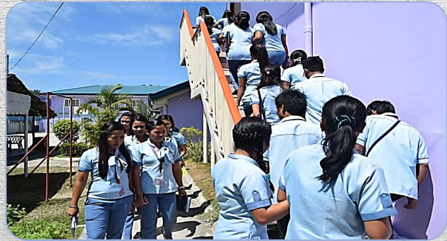
# Activity in CG