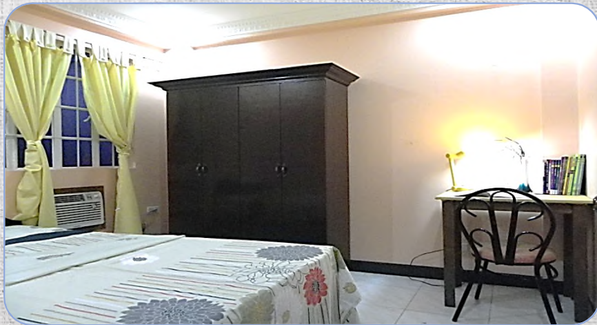
# Single Room