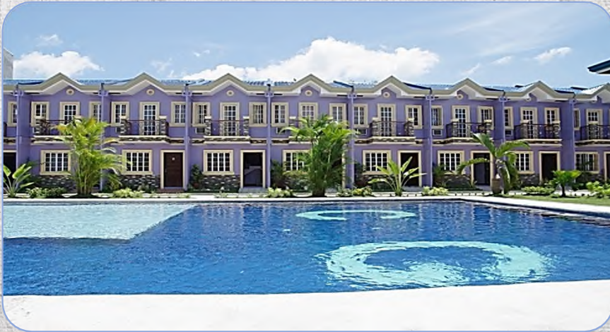
# CG ESL Center