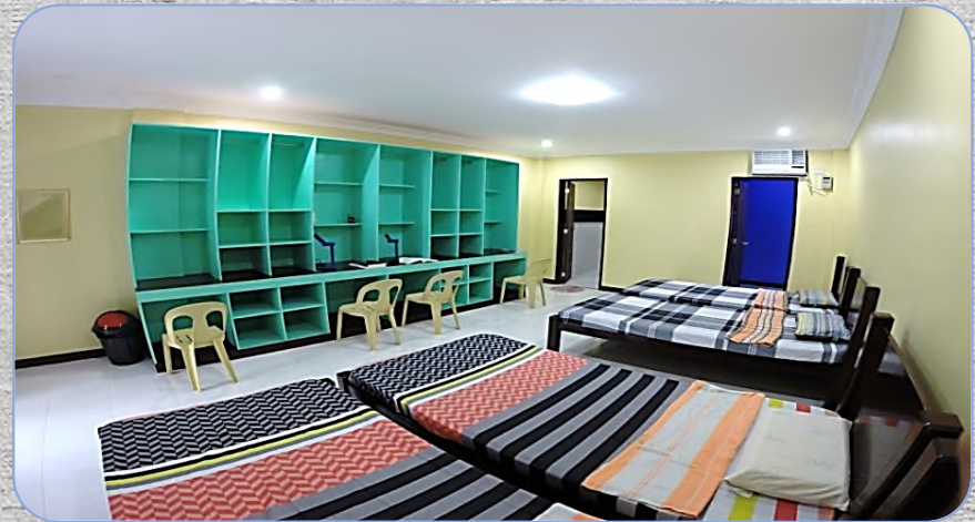
# Quad Room