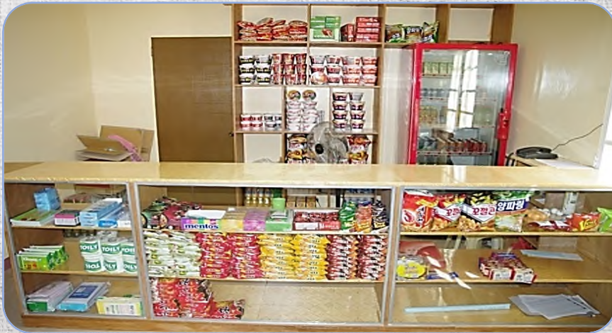
# Snack Bar