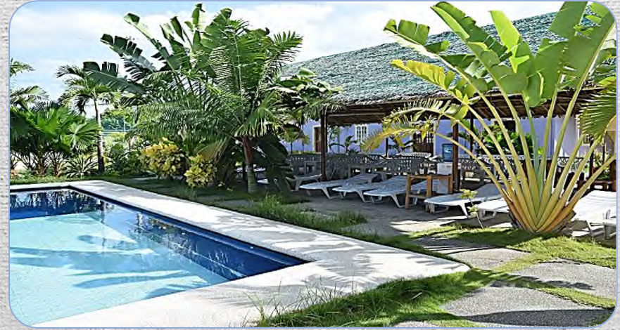
# CG ESL Center