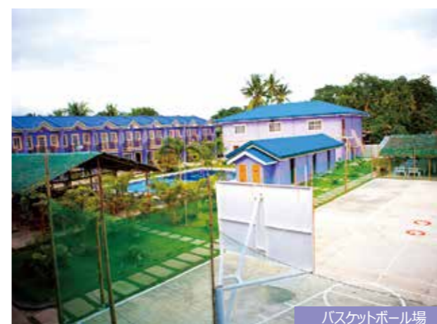
バスケットボール場