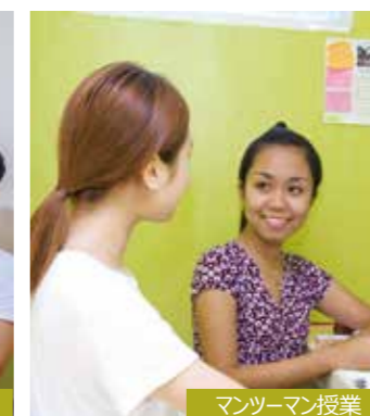
マンツーマン授業