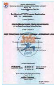
フィリピン教育部TESDA