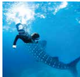
From. Banilad Nemo

If you want to study English in an environment where there are not many Japanese, I recommend CG. These past 12 weeks were precious experiences for me.