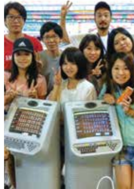
From. Sparta Sky

I had a nice time in CG for 1month. CG has strict rule that pushes me to study. For example, EOP(English only policy), and I can't go out during week days. I think that I can't have the chance to put myself in this strict environment again. You may think "Isn't it too strict?," There are humorous teachers, a lot of friends from other countries, cheering each other, and having some time to play made me not to think that it's hard to endure. I can study English practically, different from the one that I can learn in Japan. So, I could get TOEIC score surprisingly higher than before. Thanks to everyone in CG. If you're hesitating, I recommend you to study in CG!