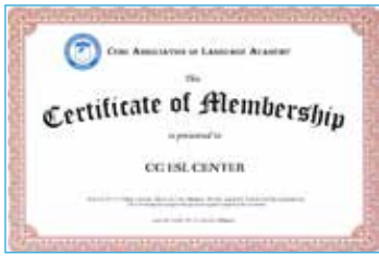
セブ語学院協会会員