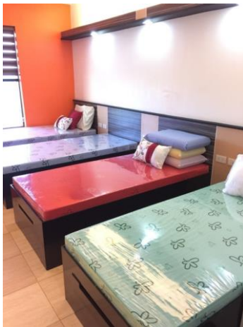
ベッドルームの様子