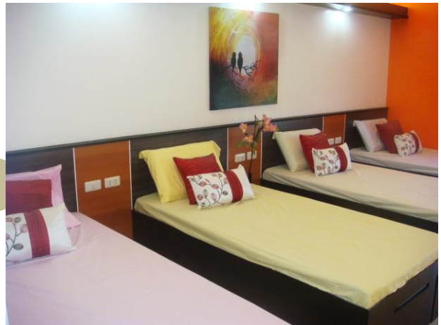
ベッドルームの様子