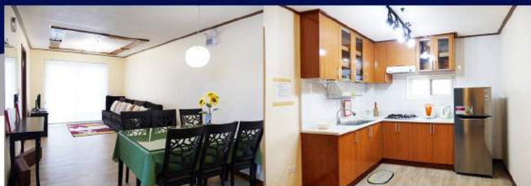
アパートタイプ APART TYPE