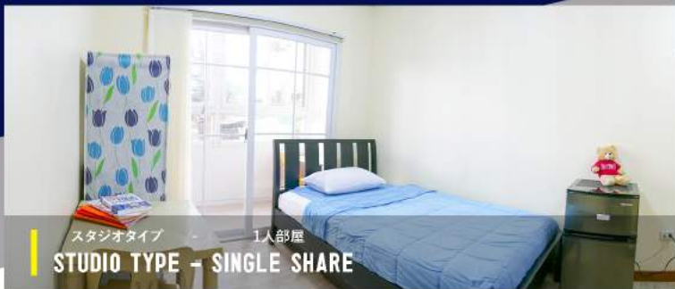
スタジオタイプ 1人部屋 STUDIO TYPE - SINGLE SHARE