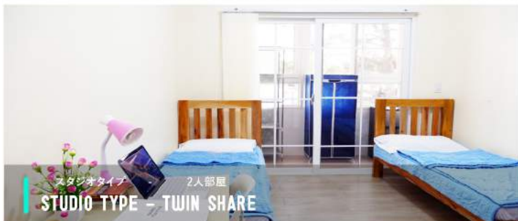
スタジオタイプ 2人部屋 STUDIO TYPE - TWIN SHARE