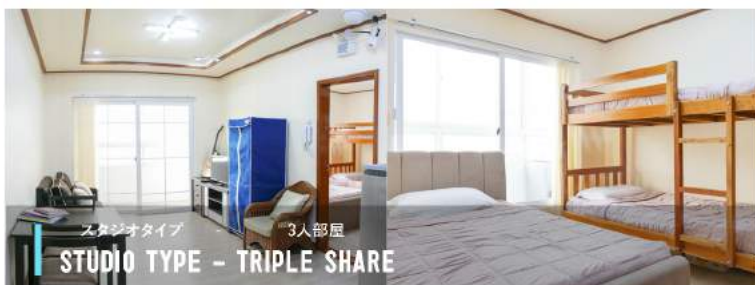
スタジオタイプ 3人部屋 STUDIO TYPE - TRIPLE SHARE