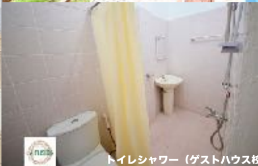
トイレシャワー (ゲストハウス校)