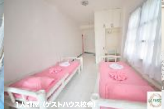
1人部屋 (ゲストハウス校舎)