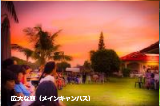
広大な庭 (メインキャンパス)