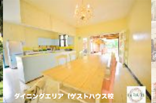
ダイニングエリア (ゲストハウス校)