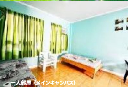
一人部屋 (メインキャンパス)