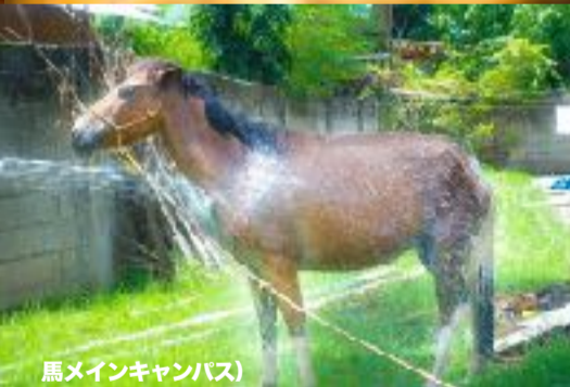
馬メインキャンパス