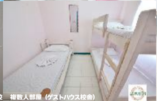
複数人部屋 (ゲストハウス校舎)