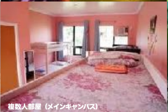
複数人部屋 (メインキャンパス)