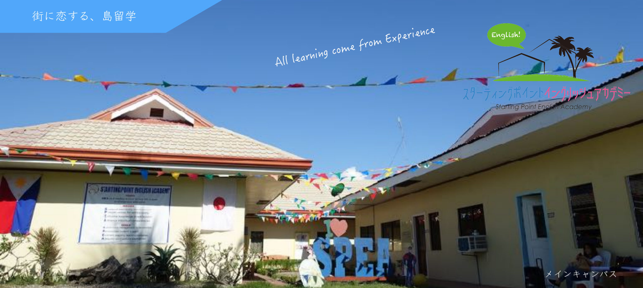
メインキャンパス