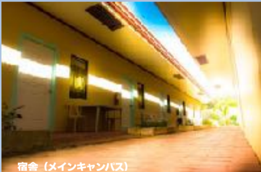
宿舎 (メインキャンパス)