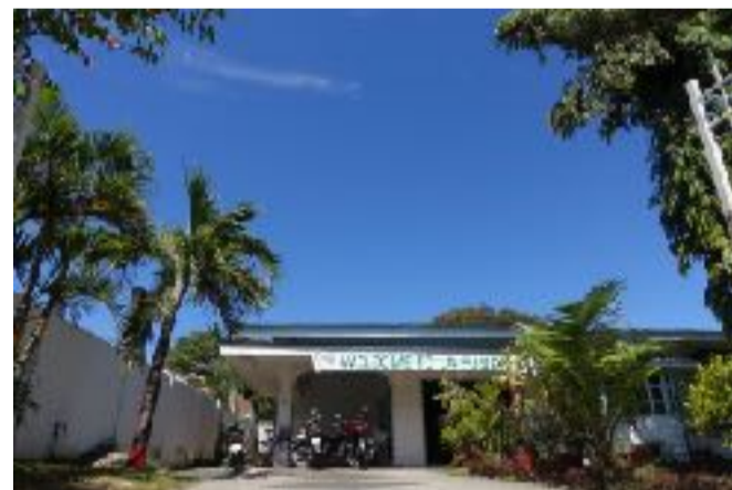
ゲストハウス校舎